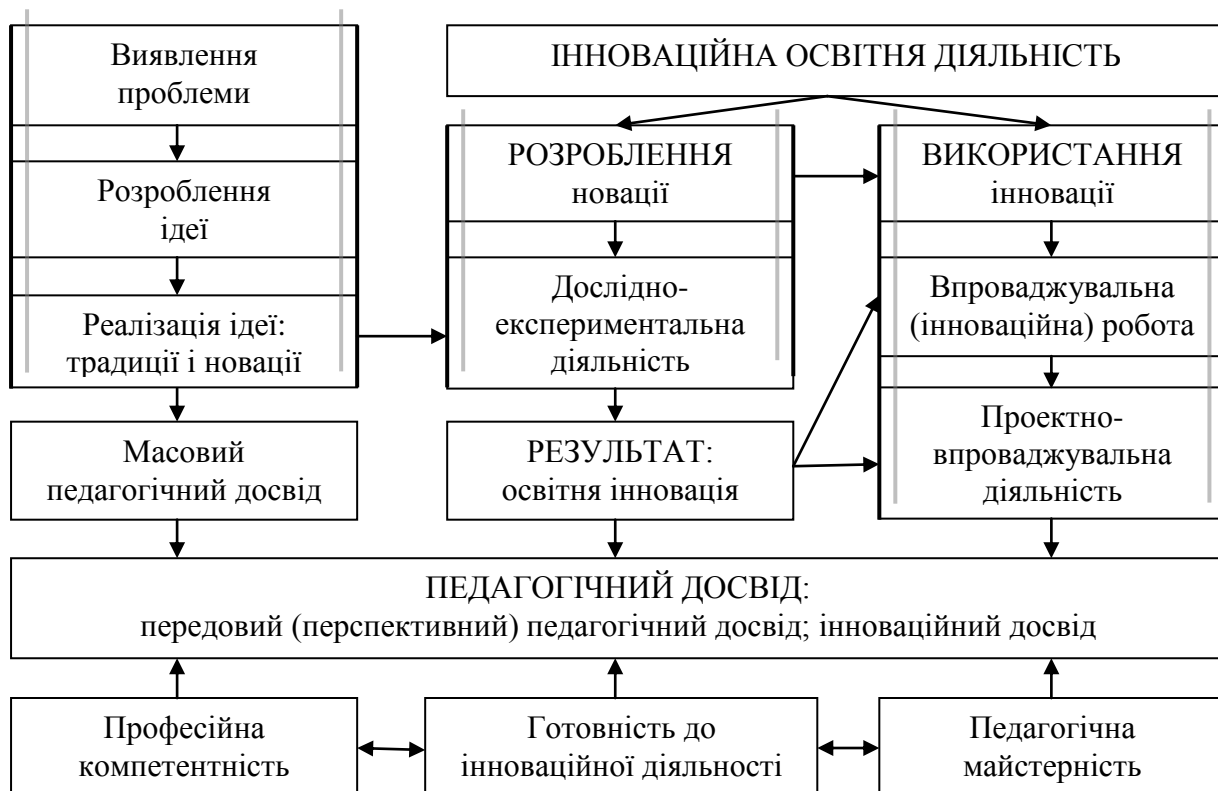
Рис. 1. Концептуально-логічна схема здійснення інноваційної діяльності

Інноваційною освітньою діяльністю у системі освіти є діяльність, що спрямована на розроблення й використання у сфері освіти результатів наукових досліджень та розробок [10].